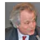
Franz Olivier Giesbert