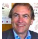
Didier van Cauwelaert